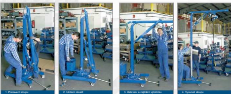
1. Postavení základny