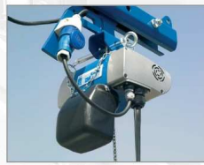
Realizace skladování cihel pomocí na jediné žepu