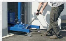
Rychlá a snadná přemisťování