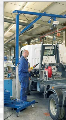
Použití minijeřábu Quickmax při práci v autodílně