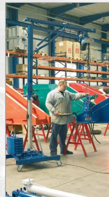
Použití minijeřábu Quickmax na dílně při správné příslušenství skladování bloků